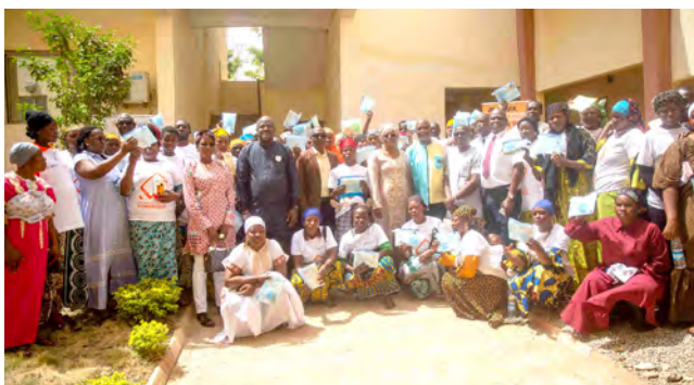
Etape de Korhogo

La date de fin prévisionnelle des dernières sessions de la 2 ème phase du programme d'alphabétisation est le 19 septembre 2025.