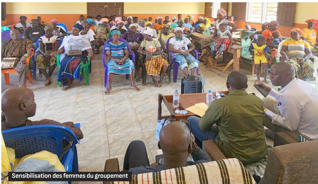
Sensibilisation des femmes du groupement