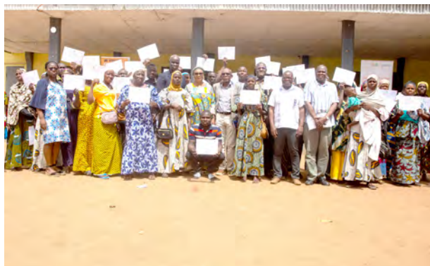
Kouto : 25 février 2025