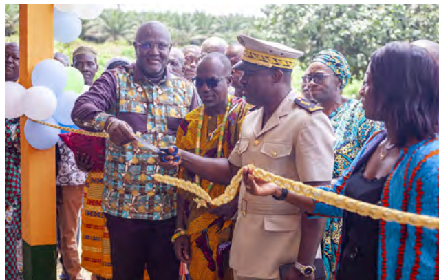
Coupure du ruban symbolique du nouveau bâtiment de l'EPP Kodjokro

La cérémonie de remise officielle des clés du bâtiment a eu lieu le 2 avril 2025 sur le site de l'école