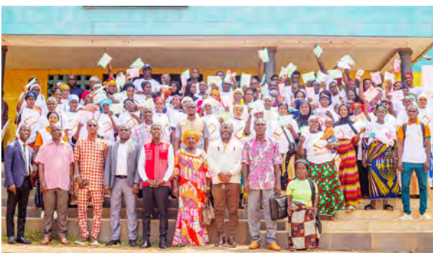
Etape de Gagnoa