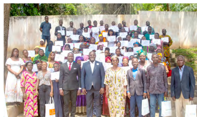
San-Pédro : 19 février 2025