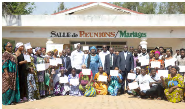
Bouaké : 11 décembre 2024

Le taux d'achèvement global des formations de la phase 1 est de 92% à Abidjan et de 97,6% à l'intérieur du pays.