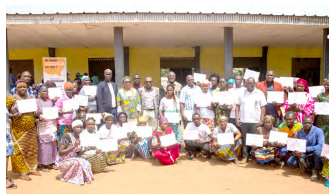
Boundiali : 25 février 2025