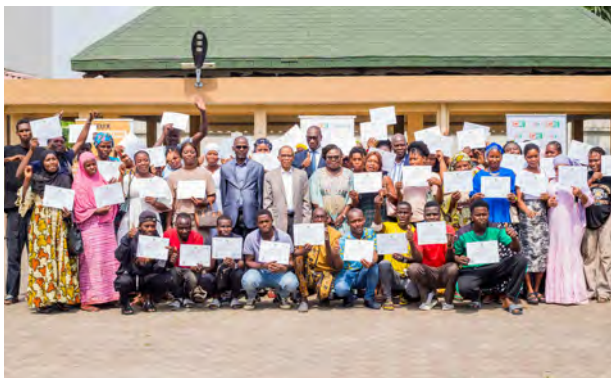
Treichville : 20 décembre 2024