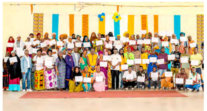
Daloa : 11 décembre 2024