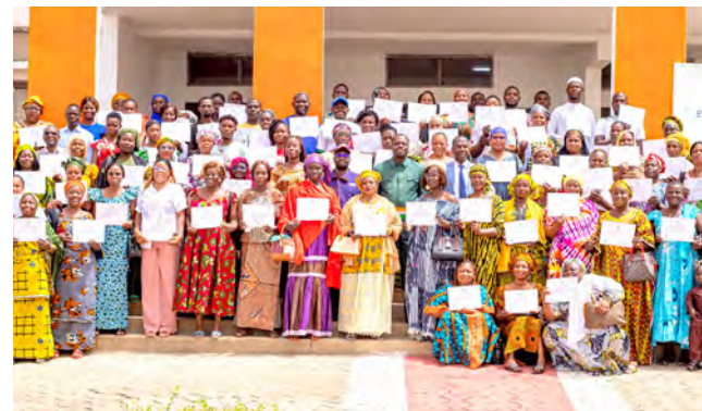
Bondoukou : 25 février 2025