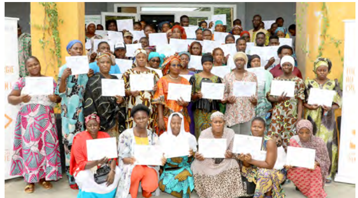
Attécoubé : 29 novembre 2024