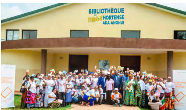
Etape de Port-Bouët