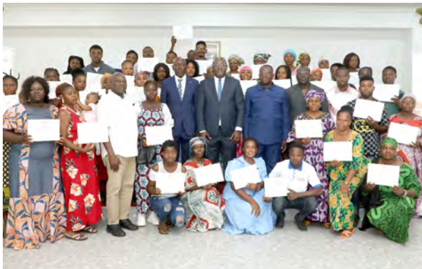
Koumassi : 27 novembre 2024

Au terme des 2 phases, les 2 000 bénéficiaires pourront ainsi franchir la ligne de l'alphabétisation pour leur autonomisation et pour leur transformation sociale.