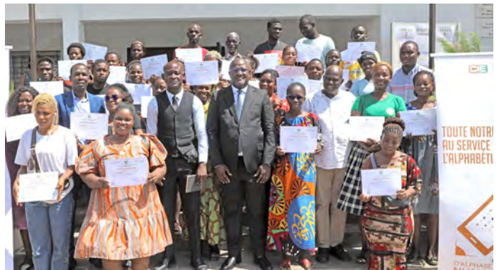
Yopougon : 26 novembre 2024

La mise en œuvre de ce programme dont l'objectif est de permettre aux bénéficiaires d'acquérir les aptitudes de base pour la lecture, l'écriture et le