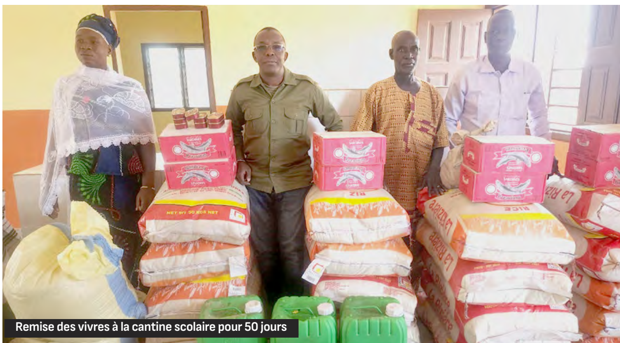
Remise des vivres à la cantine scolaire pour 50 jours